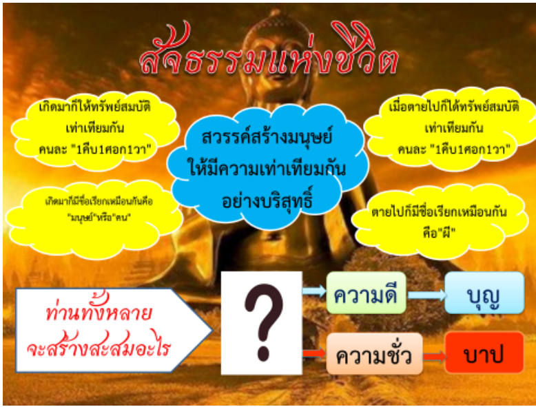
ภาพที่ 9 : สัจธรรมแห่งชีวิต

ในการกำหนดปัจจัยสู่ความสำเร็จ นั้น คณะทำงานปัจจัยดีที่ 1 ได้ ค้นหา KSF : Key Success Focus เพื่อให้คนเป็นคนดี ประกอบด้วย 1) การกลัวบาป 2) ละจากการทำชั่ว 3) ทำแต่ความดี จากนั้นจึงค้นหาจารีต ประเพณีและเครื่องมือในอดีตที่จะทำให้ KSF ทั้ง 3 อย่างบรรลุผล ซึ่งเริ่มจากการทำให้เกรงกลัวต่อบาป ทั้งนี้ ปัจจัยที่ทำให้คนกลัวบาปคือ ความเชื่อในนรก และสวรรค์ ว่ามีจริง เชื่อในบาปบุญคุณโทษและเกรงกลัวต่อสิ่งศักดิ์สิทธิ์ เพราะหากคนไม่มีความกลัวบาปแล้ว ย่อมทำสิ่งที่ไม่ดีได้ทุกเรื่อง นั่นคือ การทำชั่ว และหากคนกลัวบาปแล้ว จะไม่ทำชั่ว นั่นคือการเป็นคนดี และหาก ประพฤติในสิ่งที่ดีที่ชอบ ก็เป็นการทำดี นั่นเอง เมื่อมีปัจจัยและเป้าหมาย เพื่อให้คนเป็นคนดี จึงได้มีการถอดบทเรียน เชื่อมกฎหมายและจารีตประเพณี