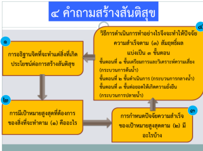
ภาพที่ 5 : คำถามสร้างสันติสุขด้วยบันไดสู่ความสำเร็จ 7 ขั้น

ทั้งนี้ โดยมีการกำหนดคำถามหลักที่สำคัญ 4 คำถามเพื่อประกอบการวิเคราะห์และกำหนด “บันไดสู่ความสำเร็จ 7 ขั้น” ดังภาพที่ 5 ต่อไปนี้