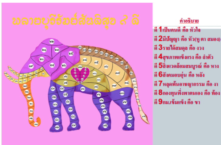
ภาพที่ 2 : ภาพผลบุญวิธัมภ์สันติสุข 9 ดี