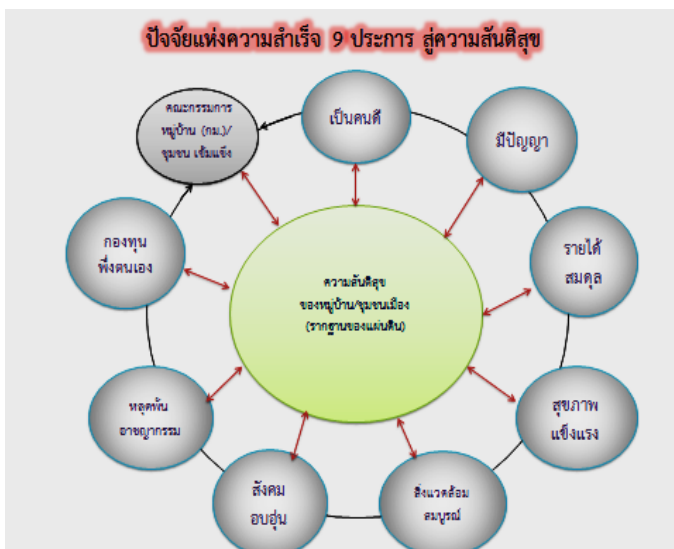
ภาพที่ 1 : ปัจจัยความสำเร็จ 9 ประการ สู่ความสันติสุข