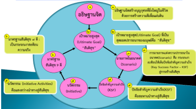
ภาพที่ 3 : วงจรรการขับเคลื่อนการพัฒนาจังหวัดบุรีรัมย์ด้วยตัวแบบระบบ การบริหารจัดการรายกรณี (B-CM Model : Burrirum Case Management Model)

สำหรับ B-CM Model นั้น เป็นการพัฒนาขึ้นจากประสบการณ์การ พัฒนาของอดีตผู้ว่าราชการจังหวัดบุรีรัมย์ (นายเสรี ศรีหะไตร) ตั้งแต่เมื่อดำรง ตำแหน่งนายอำเภอโกสุมพิสัย จังหวัดมหาสารคาม อำเภอสิเกา จังหวัดตรัง รองผู้ว่าราชการจังหวัดปัตตานี และรองผู้ว่าราชการจังหวัดสงขลา กระทั่งขึ้น ดำรงตำแหน่งผู้ว่าราชการจังหวัดพัทลุง และกลายมาเป็น B CM Model (Burrirum Case Management Model) เมื่อเป็นผู้ว่าราชการจังหวัดบุรีรัมย์ ตามลำดับ ซึ่งเปรียบเสมือน “บันไดสู่ความสำเร็จ 7 ขั้น” ประกอบด้วย 1) ขั้น ที่ 1 กำหนดเป้าหมายสูงสุด 2) ขั้นที่ 2 กำหนดปัจจัยสู่ความสำเร็จ 3) ขั้นที่ 3 กำหนดเป้าประสงค์ 4) ขั้นที่ 4 กำหนดตัวชี้วัดความสำเร็จ 5) ขั้นที่ 5 วางแผน ปฏิบัติการ ทั้ง ระดับต้นน้ำ กลางน้ำและปลายน้ำ ขั้นที่ 6 ปฏิบัติตามแผน ขั้นที่